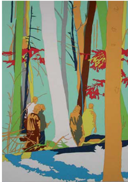
Lisa Ruyter: Home of the brave, 2003

El CGAC muestra estos días una exposición colectiva con grandes nombres del arte más actual. Un buen comienzo de temporada que tiene truco: no hablamos aquí de una exposición de tesis, sino de mostrar el conjunto reunido por unos coleccionistas. Un conjunto, en este caso coherente, pero no por ello menos subjetivo. Esto nos da pie para, además de comentar la muestra, analizar la situación cada vez más generalizada de que los centros y museos acepten colecciones privadas para llenar sus salas. La tendencia, como señala Elena Vozmediano, “a dejar que la cultura empresarial marque la pauta”.