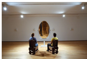
Espectadores junto a la pieza de Louise Bourgeois