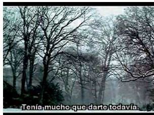
ST/T (De la serie If you leave me... can I go with you?), 2006

Galería Ad Hoc. Joaquín Loriga, 9. Vigo. Hasta el 6 de enero. De 4.000 a 5.800 euros